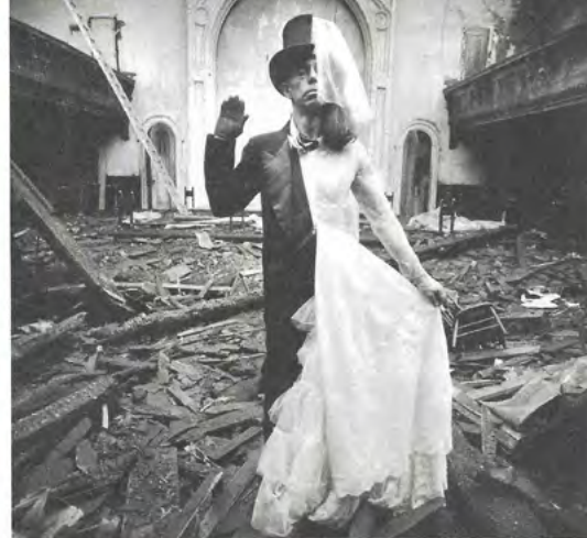
Foto per gentile concessione di Cortesi Gallery, Galerie Michaela Stock, Feed Contemporary Gallery, Mario Cucinella Architects